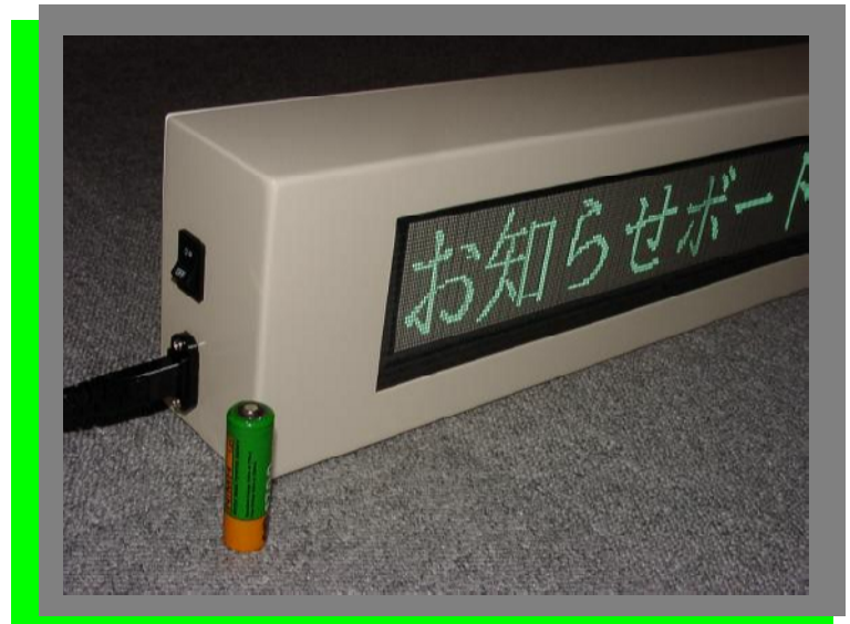
(単3電池との大きさ比較)